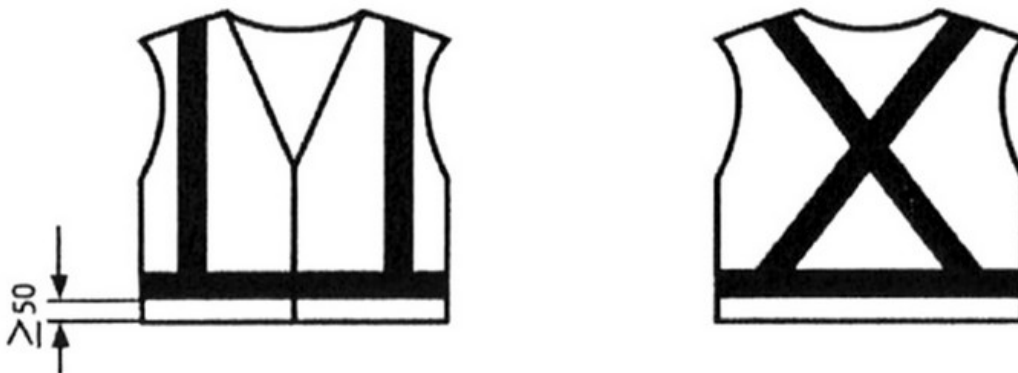
Cotas en mm

b) Una banda horizontal que rodee el torso, y bandas que unan aquélla de adelante hacia atrás por sobre cada hombro. La parte baja de la banda del torso debe estar a una distancia mínima de 50 mm del borde inferior del chaleco.