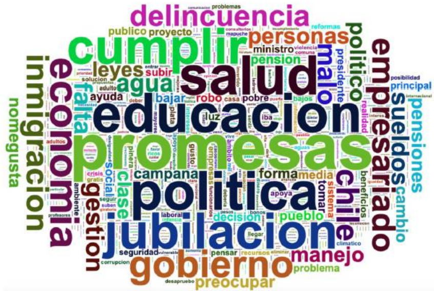
Octubre semana 2